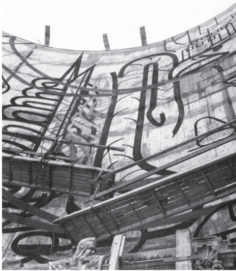
Alegoría Nacional de José Clemente Orozco, en desarrollo.

Tres discursos se escucharon en el acto protocolario en el Palacio de Bellas Artes: 1) El secretario de Educación Pública, Manuel Gual Vidal, dio la bienvenida a los delegados; 2) Jacques Maritain, filósofo francés y presidente de la Primera Conferencia de la UNESCO celebrada en París, hizo un recuento de los avances de la Conferencia anterior y 3) el presidente de la República, Miguel Alemán Valdés, se dirigió a la audiencia con un texto retórico acorde con la solemne ceremonia.