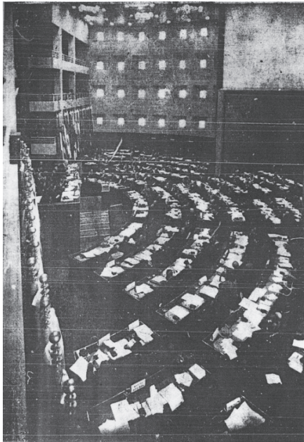
Decimonovena sesión plenaria. Miércoles 3 de diciembre de 1947. Aspecto de los trabajos de la Segunda Conferencia en el auditorio de la ENM.

Aquí se celebró, del 6 de noviembre al 3 de diciembre de 1947, la Segunda Reunión de la Conferencia General de la UNESCO, bajo el influjo bienhechor de Benito Juárez, a quien se debe la declaración siguiente: LA PAZ ESTA BASADA EN EL RESPETO A LOS DERECHOS DE LOS DEMAS.