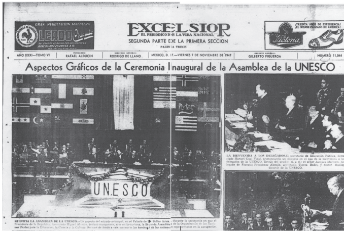
Crónica periodística del 6 de noviembre de 1947.