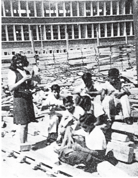
El Departamento de Señoritas atestiguó la demolición del edificio de Santo Tomás y la construcción de la obra de Pani.