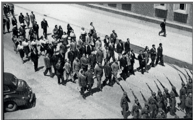
El regreso a casa.