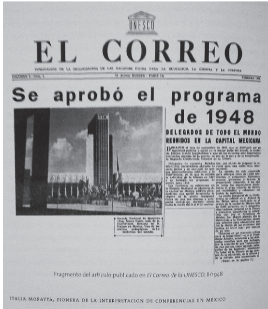
Medio de difusión de la UNESCO.

(...) un maestro genuino es un emisario viril de la libertad, de la paz y de la educación. Que un educador ejemplar por su vida y por sus lecciones, depure el medio que lo rodea, ya que del verdadero educador cabe afirmar que, como el fuego, lo trueca todo en su propia naturaleza, de manera que no podemos causarle daño y sí agradecerle cuanto hace por difundir la luz del conocimiento, ilustrar la inteligencia y propagar los ideales de equidad y de justicia. (p. 74)