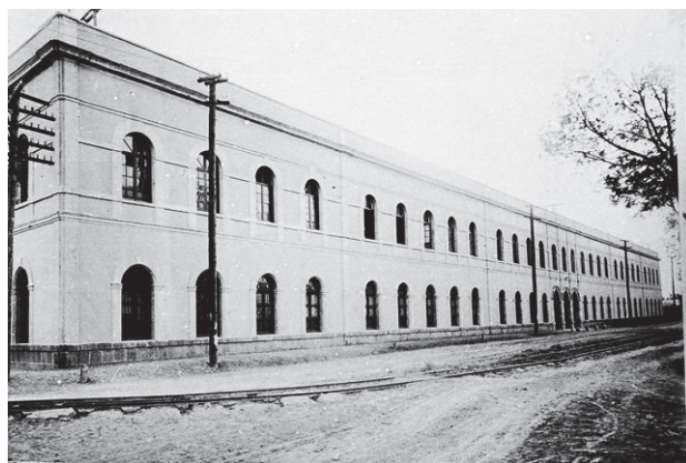
Colegio Salesiano, sede del Departamento de Varones.