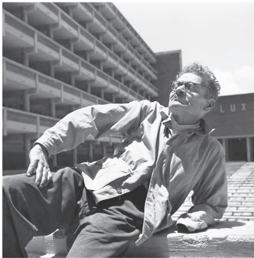
José Clemente Orozco trabajando en “ Alegoría Nacional ”.

había iniciado en el teatro al aire libre de la ENM, también mostró los proyectos de los murales “ Muerte y fin de la ignorancia ”, así como los de “ El pueblo se acerca a las puertas de la escuela ”, frescos ubicados en el vestíbulo de la torre de la ENM. Estas obras fueron entregadas en abril de 1948. Es importante señalar que, durante la Cuarta Conferencia de la UNESCO, celebrada en París en 1949, dicho organismo realizó un homenaje al pintor jalisciense al enterarse de su muerte en ese año.