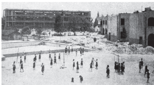
Panorámica de dos normalismos.

En febrero de 1945, se presentó el proyecto para la construcción de los edificios de las nuevas escuelas Normales formadoras de maestros. En términos generales se previó que el CAPFCE contaría con un presupuesto de sesenta millones de pesos; sin embargo, sólo se contó con la mitad del dinero. Se formaron dos comisiones que pudieran planificar y vigilar el uso de los recursos: la patrocinadora, que buscaba las aportaciones de la iniciativa privada y la administradora conformada por tres comités: jurídico, de contratación, de gastos y de dirección técnica. Para el último, fue considerado el arquitecto Mario Pani, al que a partir de este momento se le encomendó presentar sus propuestas para el edificio de la ENM y del Conservatorio Nacional de Música. Es durante 1945 cuando se inicia pues, la demolición de la Hacienda de Santo Tomás y la construcción del nuevo edificio de la ENM.