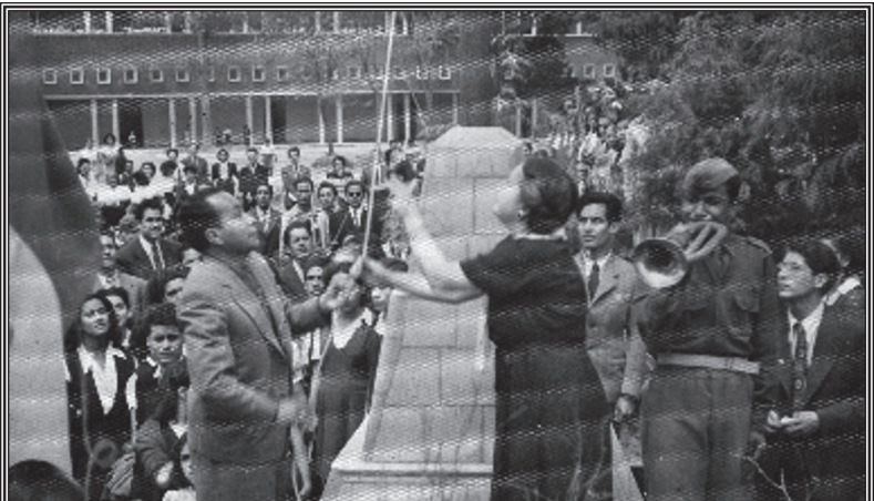
Participación de los directores en la Ceremonia Cívica.