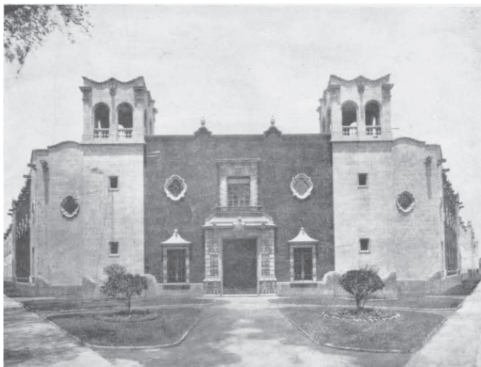
El edificio de Santo Tomás.

El secretario de Educación Pública, Jaime Torres Bodet, en 1943 inició un proceso proyectivo para crear tres grandes zonas educativas centralizadas en el entonces Distrito Federal. La capacidad de los planteles educativos existentes ya resultaba insuficiente, así que se planeó construir nuevas zonas escolares que fueran congruentes con el funcionalismo de la época: menos con más.