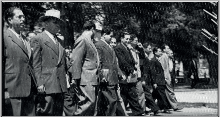
Descubierta del desfile.