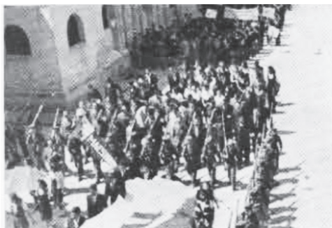
Departamento de Varones y Departamento de Señoritas.