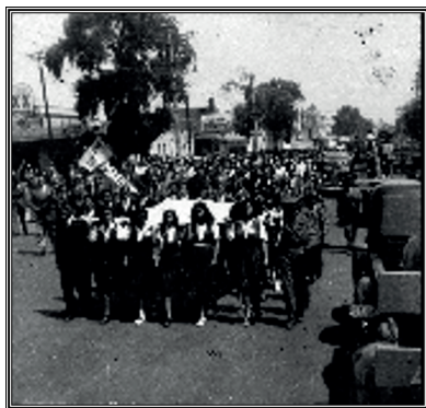
Normalistas dirigiéndose, en desfile, al nuevo edificio.

La añeja demanda de coeducación que defendieron los normalistas del Departamento de Varones ahora cobraba un sentido distinto, pues el hecho de que fuera el sector femenino quien invitara al regreso a los varones normalistas, diluía la visión conservadora del Departamento de Señoritas.